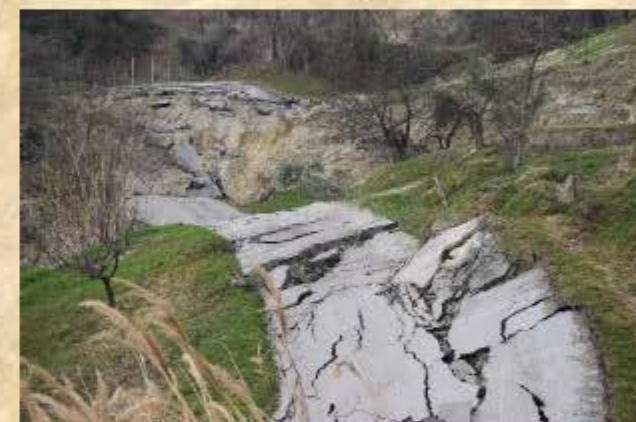
La Frana di Ponzano di Civitella del Tronto