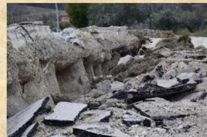
Effetti della frana di Ponzano di Civitella del Tronto