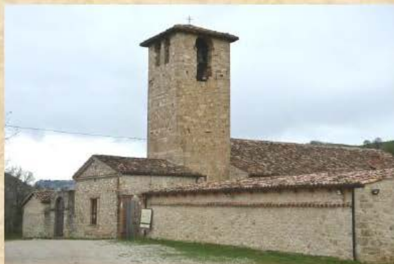
Chiesa di San Pietro Apostolo - Sede del Convegno Campovalano - Campli (TE)