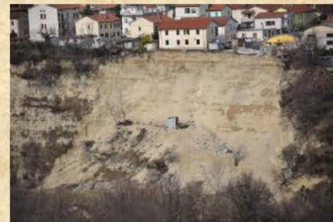
Panoramica della Frana di Campli