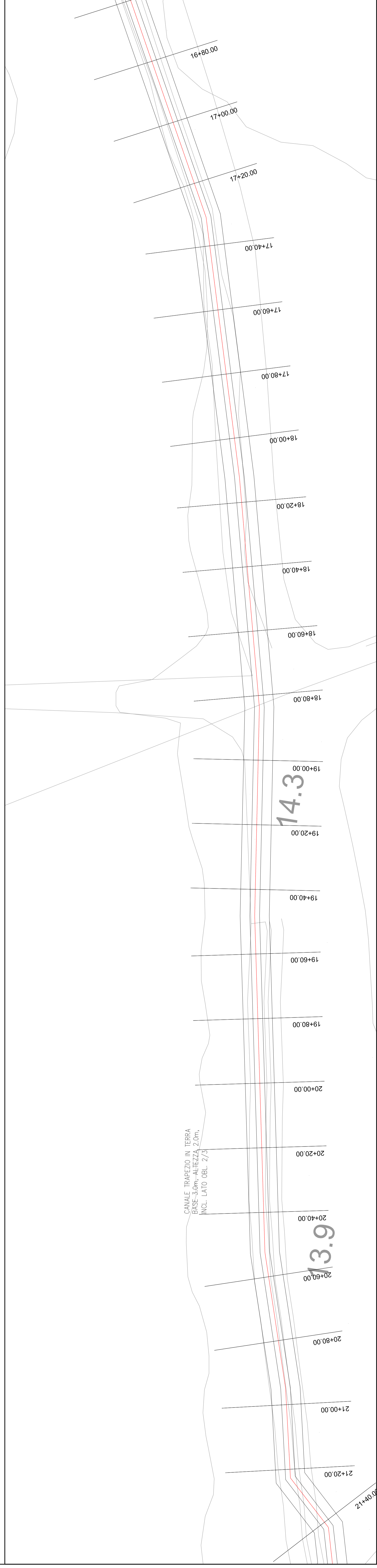
Planimetria— Tavola 2