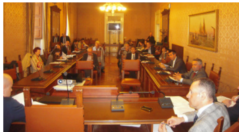
2nd Basin Assembly (March, 31 st , 2014)