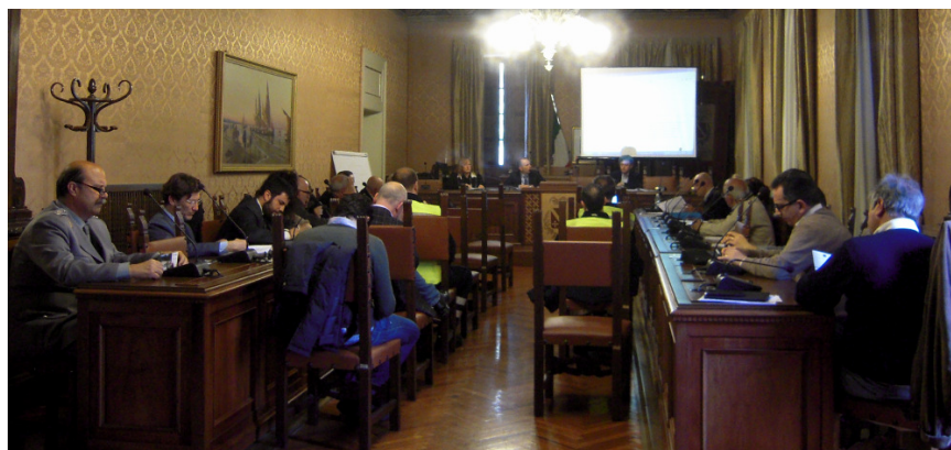
Workshop with stakeholders and Framework Agreement signing (April, 7 th , 2014)