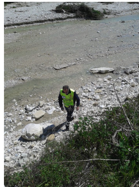
PROVTE Ecological Voluntary Guards at work on the Tordino river (April/May, 2014)