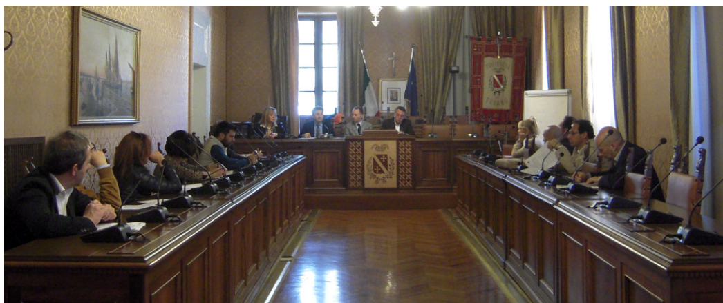
3rd Steering Committee (March, 19 th , 2014)